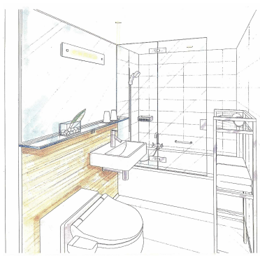
シャワースクリーン

ニュースリリースに関するお問い合わせ先 ホテルグランヴィア広島 企画課 担当:中野・上野 〒732-0822 広島市南区松原町1-5 (JR広島駅新幹線口) TEL: 082-262-1218 (直通) FAX: 082-262-3349 e-mail: k_nakano@hgh.co.jp URL: www.hgh.co.jp