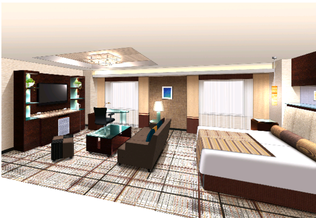
20階 客室 新設TFタイプ

今後も、ホテルグランヴィア広島は、お客さまの更なる満足度向上を目指し、順次館内施設の改装を実施してまいります。