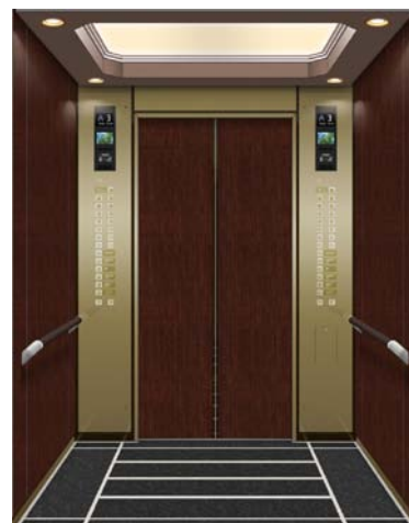
エレベーター完成イメージ

空調器、戸開走行保護装置、2重ブレーキ・P波センサー付き 地震管制運転装置、鏡、手摺、遠隔救出機能(モニター付き)、 緊急時用物入れ椅子