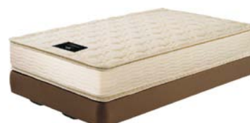
シモンズ社製ポケットコイルベッド (ピロートップ仕様)

ピロートップ仕様のシモンズ社製ポケットコイルベッド バスローブ、カプセル式コーヒーマシン (無料)、加湿機能付き空気清浄機、ベッドスロー、ベッドクッション、アメニティ (デタユ・ラ・メゾン 平成 26 年 4 月から新規導入)