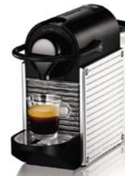
カプセル式コーヒーマシン

高反発マットレスパッド (エアウィーヴ)、枕 (エアウィーヴ)、カプセル式コーヒーマシン (無料・但しセミダブルルームはドリップコーヒー)、加湿機能付き空気清浄機、ベッドスロー、クッション、フロアスタンド (セミダブルルームのみ)、 ※以上 4 月 1 日 (火) から新規導入