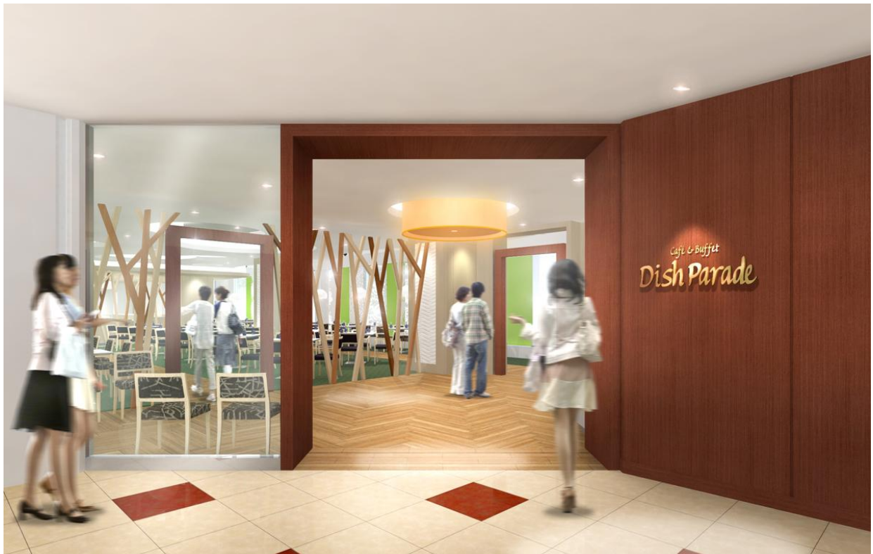
店舗入口のイメージ